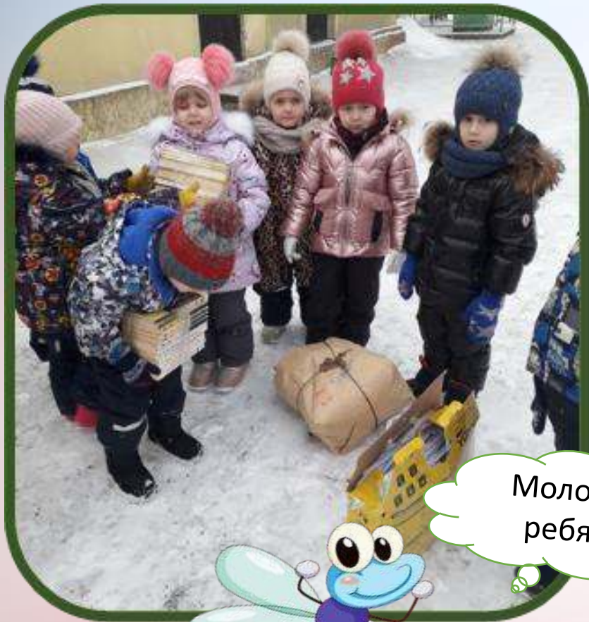
Акция «Сдай макулатуру - спаси дерево!»