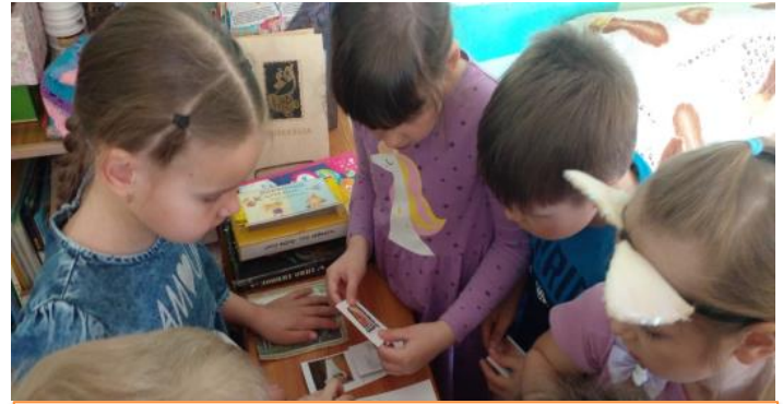
Задание № 2: Игра «Было – стало»