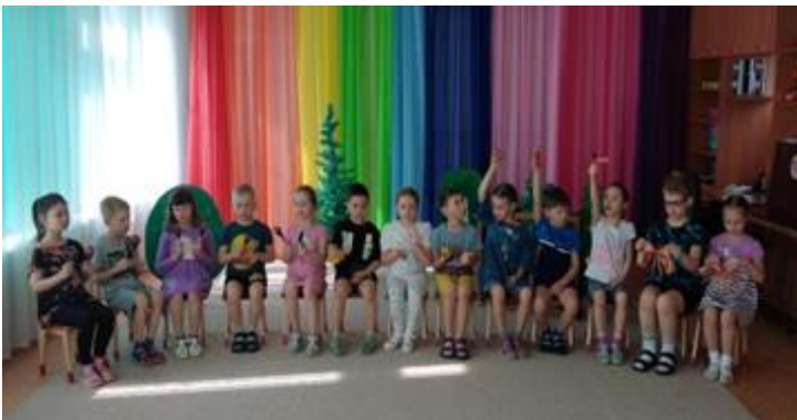
Задание № 5: Оркестр русских народных инструментов

Метафоричность народных сказок, богатейший опыт предыдущих поколений, заложенный в устном народном творчестве нашего народа, красота предметов прикладного искусства, мелодичность музыкального наследия позволяют формировать в детях стремление жить в согласии с собой и природой, даёт ответы на вопросы морали и этики во взаимоотношениях со сверстниками и старшим поколением. Помочь детям присвоить жизненный опыт предыдущих поколений в целях устойчивого развития молодого поколения и есть основная сущность нашей работы.