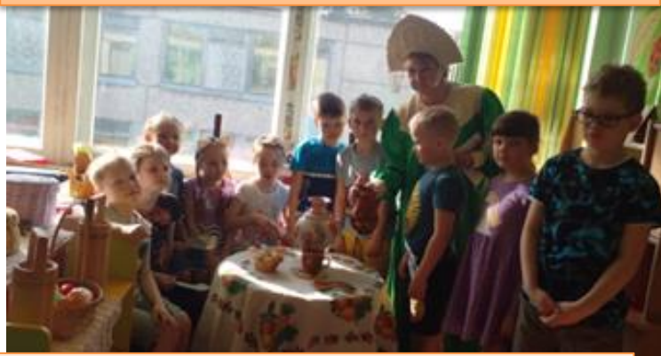
Задание № 3: «Загадки русской избы»