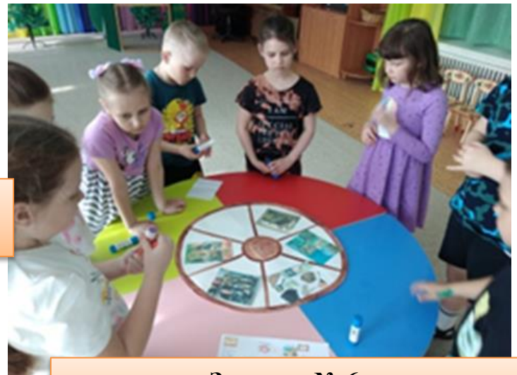
Задание № 6: «Составление колеса времени»

Метафоричность народных сказок, богатейший опыт предыдущих поколений, заложенный в устном народном творчестве нашего народа, красота предметов прикладного искусства, мелодичность музыкального наследия позволяют формировать в детях стремление жить в согласии с собой и природой, даёт ответы на вопросы морали и этики во взаимоотношениях со сверстниками и старшим поколением. Помочь детям присвоить жизненный опыт предыдущих поколений в целях устойчивого развития молодого поколения и есть основная сущность нашей работы.