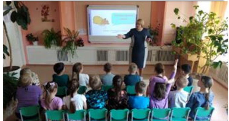
Задание № 4 Игра-викторина «Кот в мешке» (занятия древних славян)