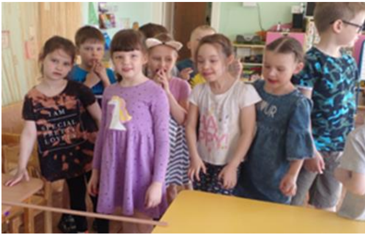
Задание № 1: Назвать 5 пословиц о смелости и отваге